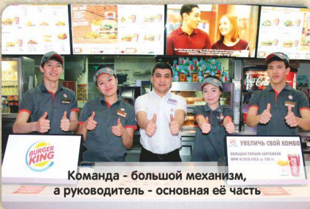
Команда - большой механизм, а руководитель - основная её часть

Благодаря достижениям в работе, в июле 2014г. был назначен на должность «Координатор смены».